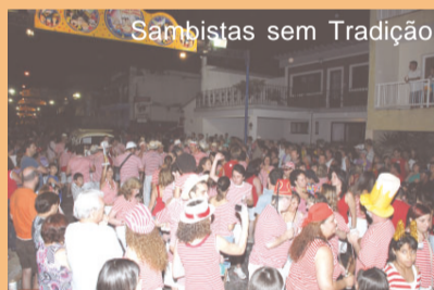
Sambistas sem Tradição