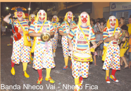
Banda Nheco Vai - Nheco Fica