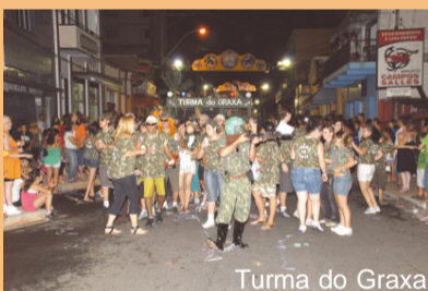
Turma do Graxa