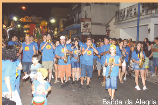
Banda da Alegria