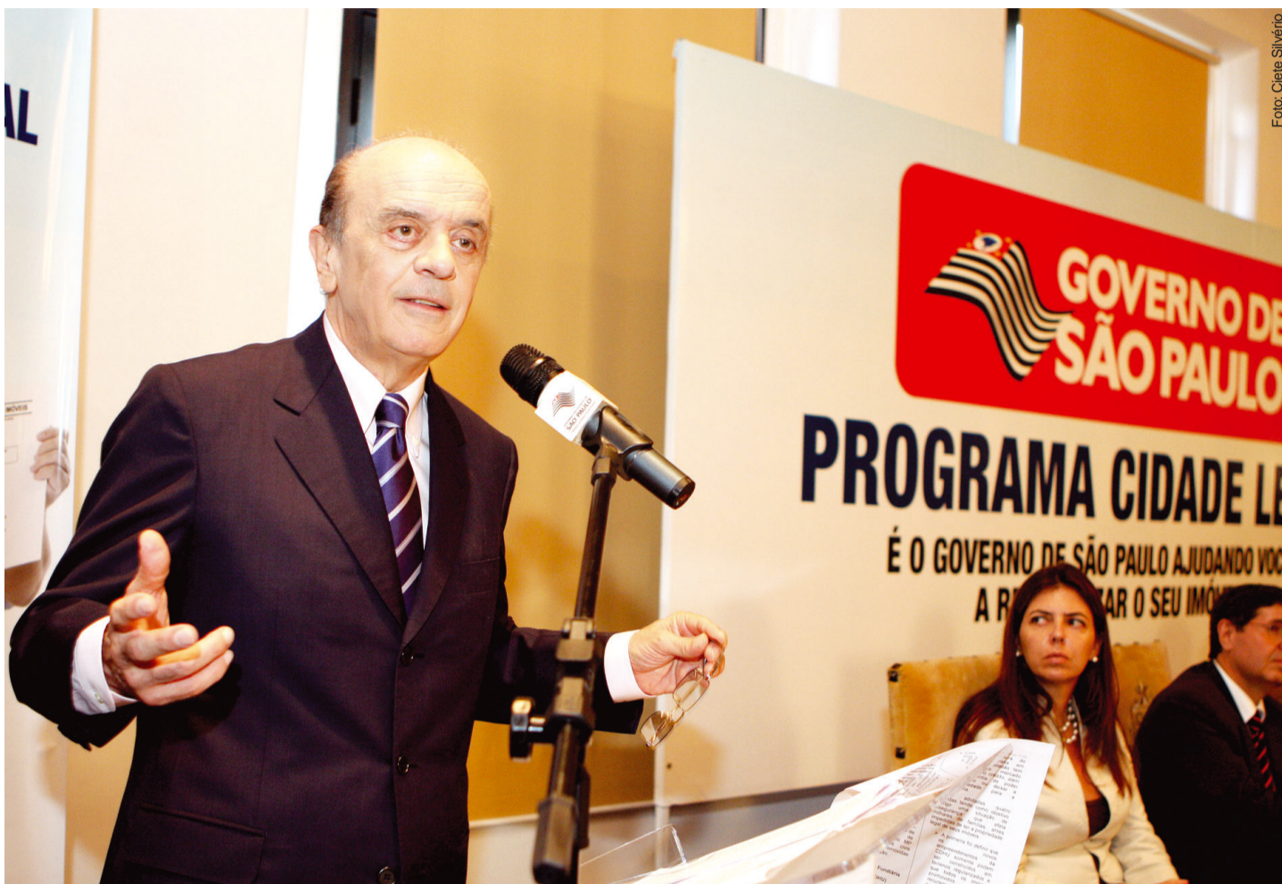
Governador José Serra, durante discurso de lançamento do programa Cidade Legal

O governador José Serra ressaltou a importância da regularização fundiária. Segundo ele, com a escritura do imóvel registrada em cartório, o comprador torna-se de fato o proprietário. Além dessa garantia, com o bem regularizado e registrado o cidadão tem acesso ao mercado formal de crédito, pode comercializar sua casa ou transferi-la para seus herdeiros, entre outros benefícios. Serra reconheceu a importância