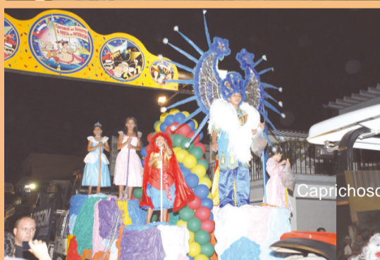
Caprichosos do Samba