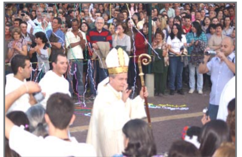
Procissão chegando à Praça no dia 15

Outro momento de especial participação da comunidade local e de visitantes da cidade ficou por conta da comemoração religiosa no dia 15 de agosto que contou com a Romaria de Campinas e de São Paulo. Desde a alvorada anunciada pela Corporação