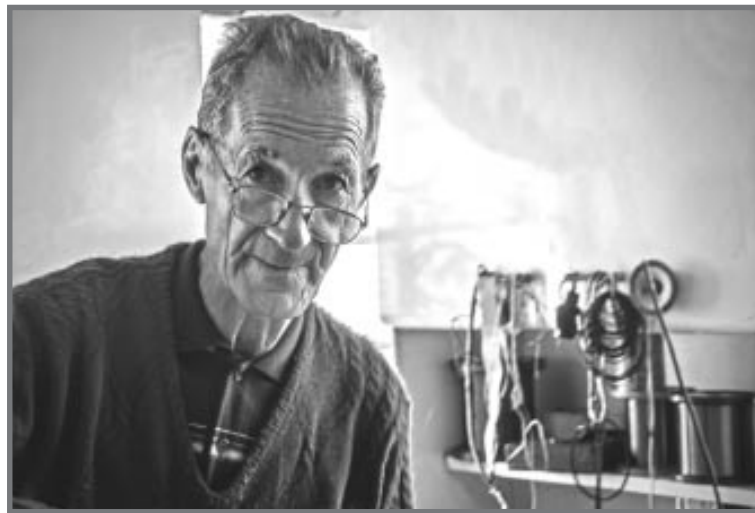
Foto "Ofício", de Paulo Nicoletti (Tuda) classificada em 1º lugar

De 15 de agosto a 17 de setembro, as fotos que participaram do Concurso estarão expostas no Palácio das Águias, na Biblioteca Municipal.