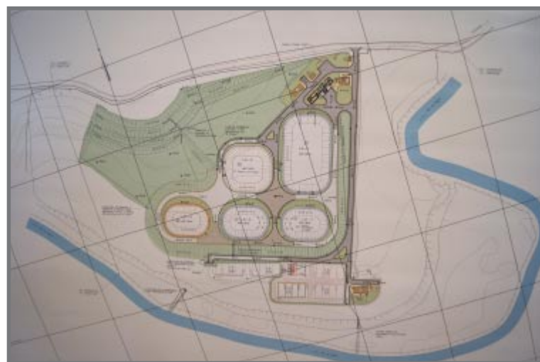
ETE Socorro- 1ª e 2ª etapas

Com um aterro sanitário, estação de tratamento de água e estação de tratamento de esgoto, Socorro estará prestando com excelência os serviços de saneamento básico de esgoto, lixo e água, afirma o diretor do Departamento Municipal do Meio Ambiente.