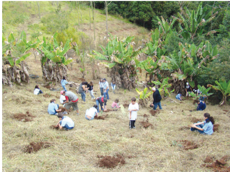
Grupo de escoteiros de Socorro contribuíram com o plantio no Parque Monjolinho

O plantio de mudas é uma das ações em comemoração aos 180 anos da cidade de Socorro, realiza-