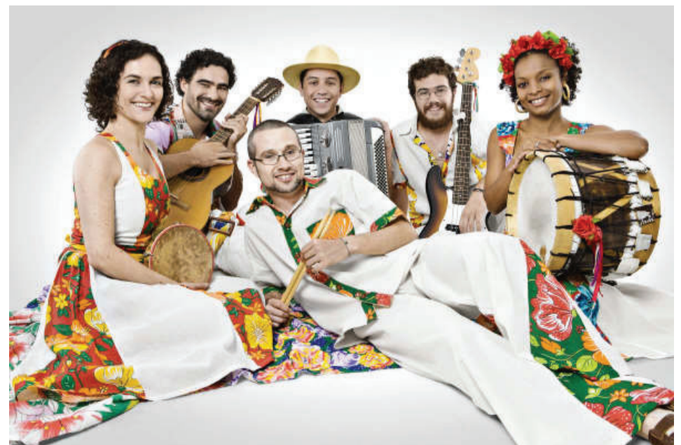
Banda Namoradeira se apresenta neste domingo, dia 19, às 21h, no palco Largo da Matriz

Socorro participou dos Jogos Regionais em Atibaia nas modalidades basquete feminino, dama, futsal, futebol, malha masculino, tênis masculino e feminino, vôlei feminino, karatê masculino e feminino e handebol feminino, que foi bem classificado nos jogos do ano passado e disputou na primeira divisão, em 2009. Apesar da eliminação no início da competição, o nível técnico das atletas surpreendeu, com bom desempenho na disputa.