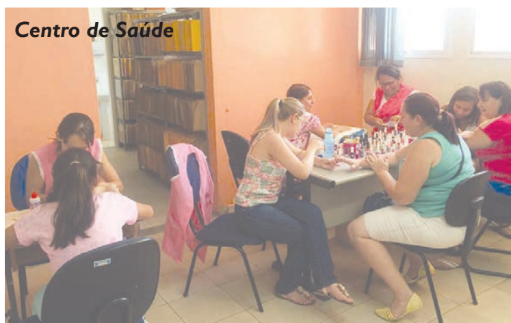
Centro de Saúde