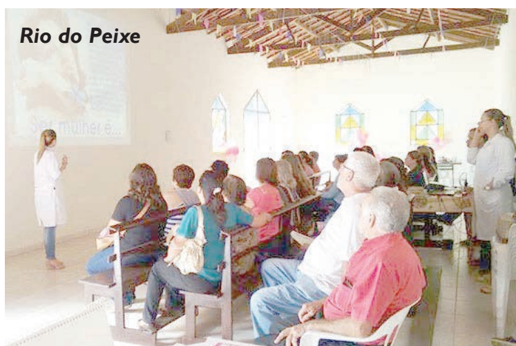
Rio do Peixe