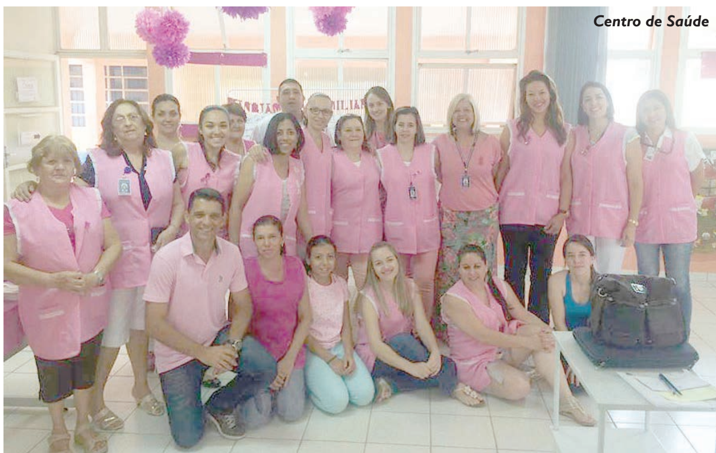
Centro de Saúde