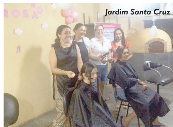
Jardim Santa Cruz