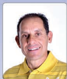
Silva Nº 01