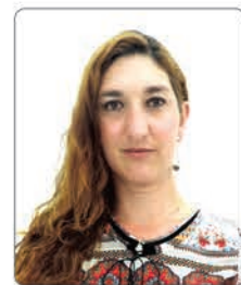
Karla da Prefeitura Nº 22