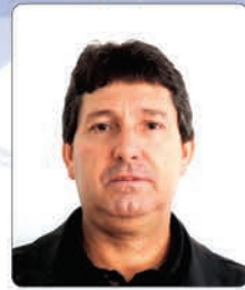
Felippin Nº 18