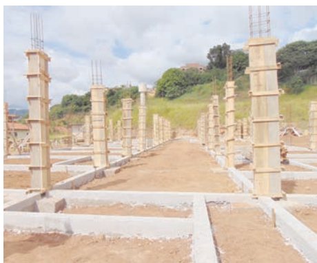
Construção de nova creche e posto de saúde no bairro do Salto