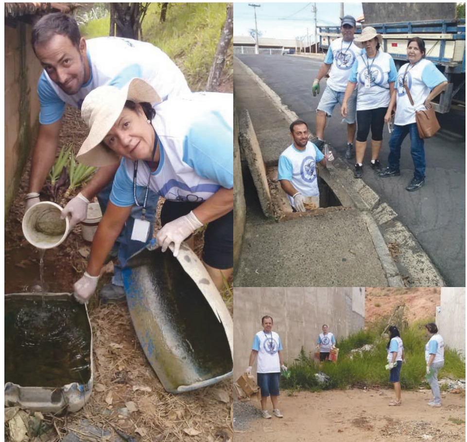
Equipe da Vigilância em Saúde realizou mutirão contra dengue

Vamos todos unirmos para evitar esta doença, pede a Vigilância.