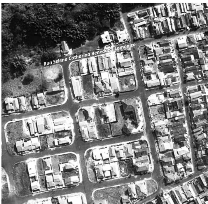
IMAGEM DA ÁREA PÚBLICA E ENTORNO IMEDIATO