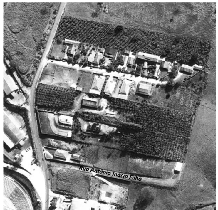
IMAGEM DA ÁREA PÚBLICA E ENTORNO IMEDIATO