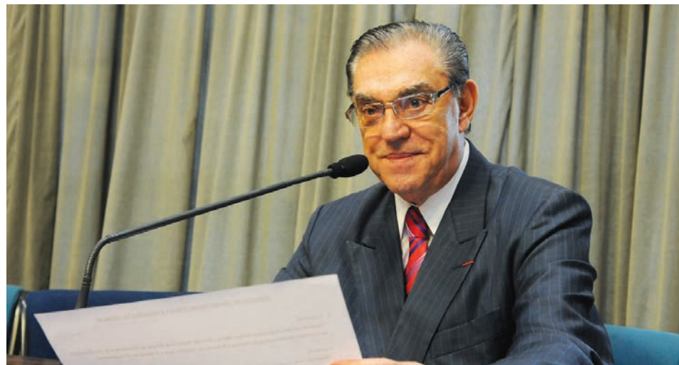
Deputado Estadual Cel. Edson Ferrarini fará palestra com o tema "Caminhos do Sucesso".

Em 10 de janeiro deste ano aconteceu a primeira mobilização da Rede Paulista de Políticas sobre Drogas, evento ocorrido em Atibaia durante a 51ª edição do "Revelando São Paulo". O grupo nasceu em um fórum sobre drogas realizado em dezembro de 2013 no município de Socorro, com representantes de 80 cidades.