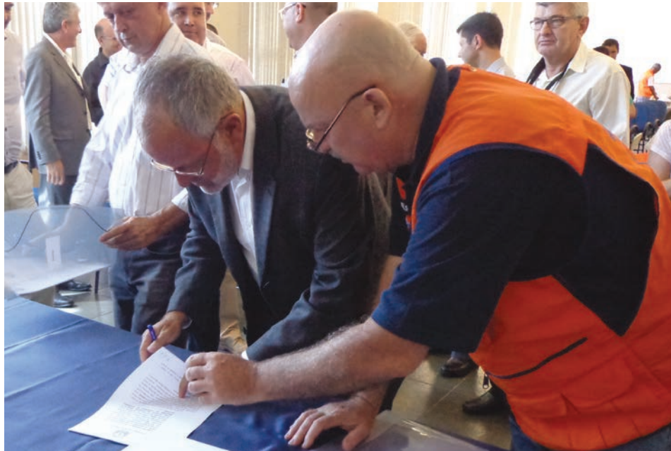
Ato de assinatura, por parte do Vice-Prefeito Municipal com a Fundag

Num cenário onde os desastres naturais são cada vez mais proeminentes é obrigação de todos os órgãos públicos ou privados estabelecerem mecanismos e ações para minimizar os efeitos adversos destes fenômenos.