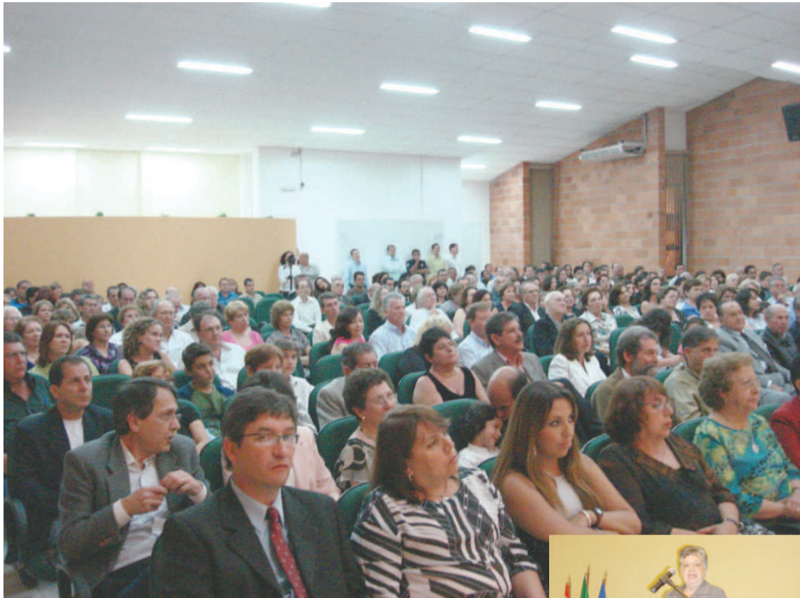
O auditório do Centro Administrativo ficou lotado durante a solenidade de nomeação e inauguração da Galeria de Prefeitos

A Prefeitura Municipal realizou na noite da sexta-feira, 21, a solenidade de nomeação do Centro Administrativo Municipal, que passou a denominar-se "Prof. Imir Baladi". Muito entusiasmo e emoção marcaram a cerimônia que reuniu políticos que foram prefeitos de Socorro e seus familiares, como também autoridades de Socorro e região. Na mesma noite foi inaugurada no saguão do prédio a Galeria de Prefeitos, um tributo aos homens públicos que colocaram sua inteligência e talentos a serviço da sociedade socorrense.