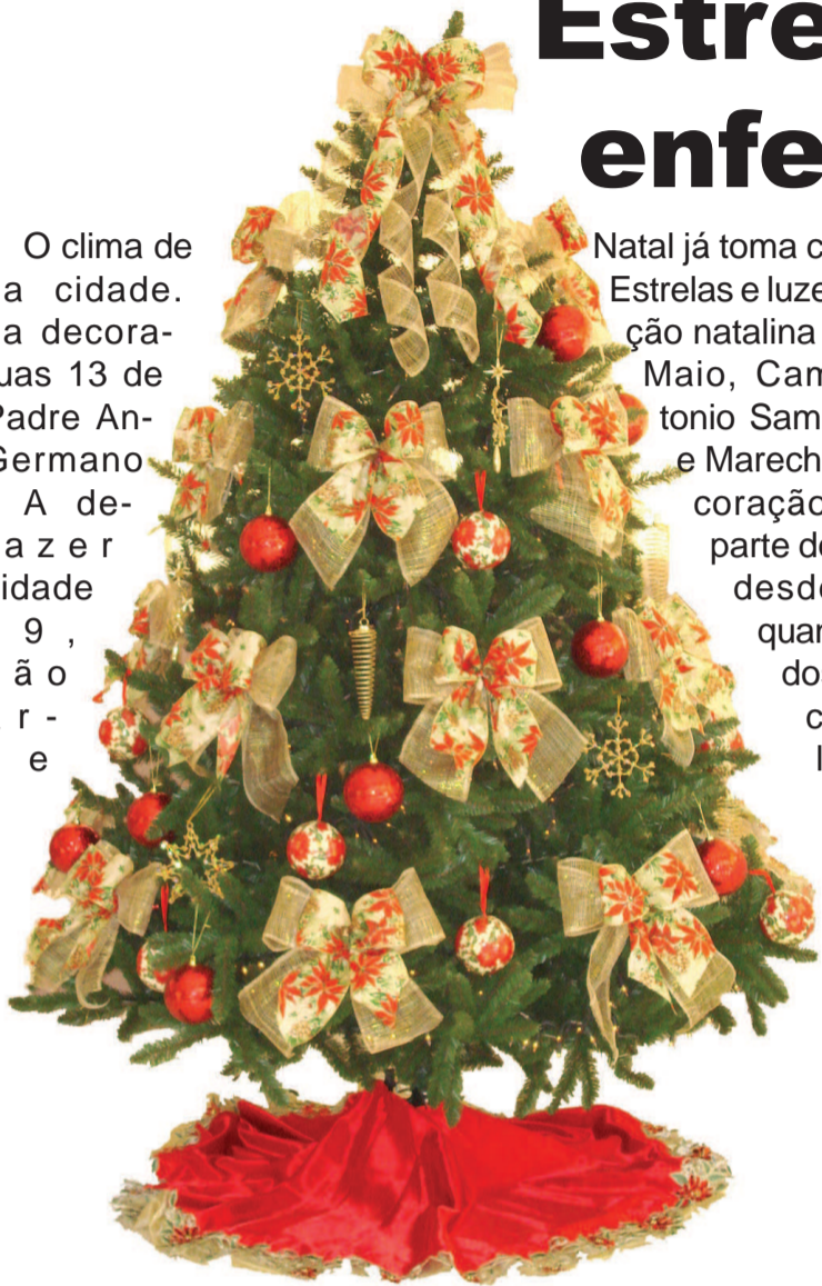
Árvore de Natal instalada no saguão do Centro Administrativo Municipal

Natal já toma conta das ruas. Estrelas e luzes fazem parte da decoração natalina instalada nas ruas de Maio, Campos Salles, Antonio Sampaio, Coronel e Marechal Deodoro.