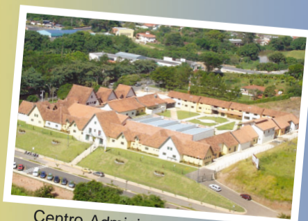
Centro Administrativo Municipal