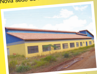
Nova sede da EMEF Prof. Eduardo R. Carvalho