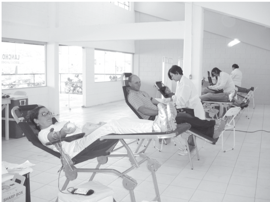
A equipe do Hemocentro de Campinas utilizou as dependências do Centro de Exposições para coleta de sangue

Ao chegar, os candidatos efetuaram um cadastro e em seguida passaram por uma pré-consulta, onde foram avaliados os primeiros quesitos que permitem ou não a doação: temperatura, peso, altura, pressão arterial e o teste para detectar anemia. Após a triagem, os doadores passaram por uma entrevista pessoal e sigilosa, e foram encaminhados para um pré-lanche,