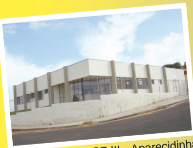
Nova sede do PSF III - Aparecidinha