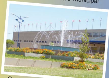
Centro de exposições e eventos