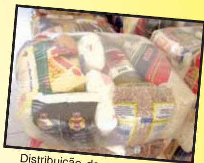
Distribuição de cesta básica

Garantir os direitos e o acesso a bens e serviços, dando condições ao cidadão de conquistar uma vida mais digna, é a missão da área da Promoção Social no município.