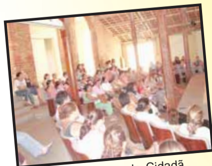
Programa Renda Cidadã