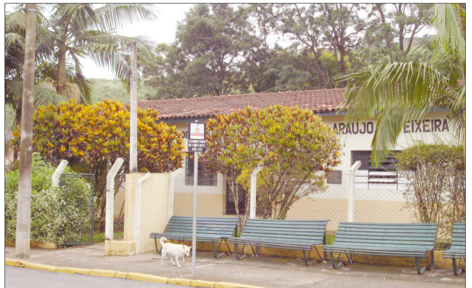
Unidade Básica de Saúde (UBS) do Jardim Araújo/ Teixeira

Com a nova especialidade, os moradores serão beneficiados com consultas ambulatoriais e cirurgias oculares, como correção de problemas de retina, córnea, órbita ocular, vias lacrimais, glaucoma e oculoplástica. Representantes das cidades de Socorro, Águas de Lindóia, Lindóia, Monte Alegre do Sul e Serra Ne-