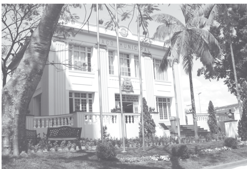
O Palácio das Águas, um dos prédios que receberão investimentos para adaptações dentro do projeto Socorro Acessível.

de mais R$ 493 mil. As obras contemplarão pontos turísticos diversos, como os portais e o mirante do Cristo, além das reformas e adaptações no centro histórico e co-