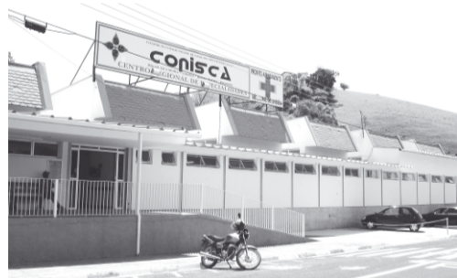
A sede do consórcio, em Lindóia, onde serão realizadas cirurgias oftalmológicas

Serviço complementa atendimento da rede básica - Para a população de Socorro, as consultas pelo Conisca irão somar aos atendimentos já realizados pela rede básica de saúde, que conta atualmente com três médicos oftalmologistas e equipamentos como o refrator e o biomicroscópio, que permite diagnóstico de catarata e glaucoma.