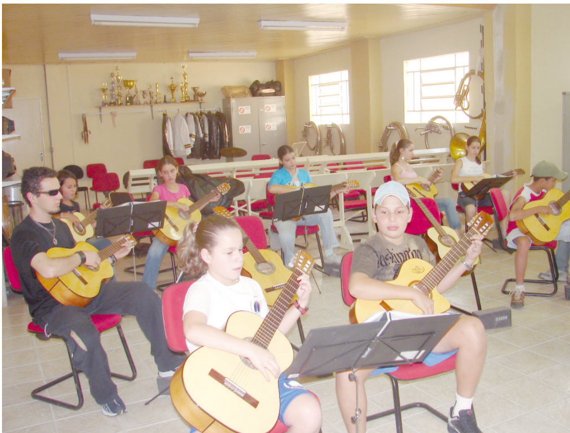
Estudantes de 8 a 18 anos participam do Projeto Guri - Pólo Socorro. Aulas gratuitas de violão e cavaquinho são ministradas no Centro Cultural, com inscrições abertas durante todo o ano

Participação ativa – A empolgação dos estudantes