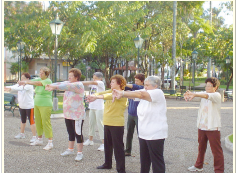
Idosos praticam aula de alongamento na Praça Nove de Julho, seguido por caminhada. Atividade é desenvolvida pelo departamento municipal de Esportes e Lazer

O Conselho Municipal do Idoso foi criado em Socorro pela Lei nº 3044/ 2004, de acordo com o previsto no Estatuto do Idoso.