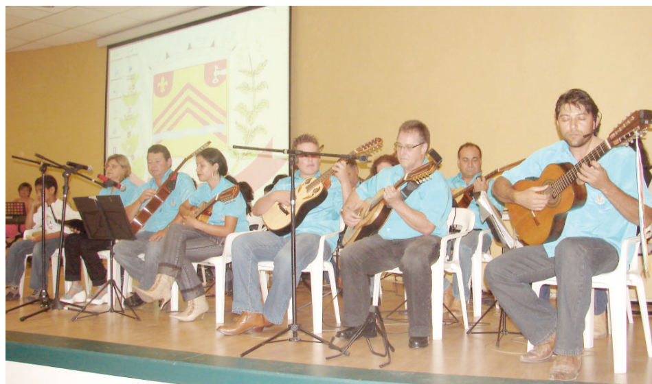
O Grupo Morena da Fronteira de Viola Caipira em noite de homenagem

O prefeito municipal também prestou sua homenagem ressaltando em discurso o compromisso do servidor público em estar sempre disponível para atender a comunidade com competência e responsabilidade. Aos professores, o prefeito disse que a missão do educador é formar pessoas e solidificar caráter. “É uma tarefa árdua, porém gratificante (...) Em Socorro estamos trabalhando para uma educação de qualidade e que prepara as crianças, adolescentes, jovens e adultos para