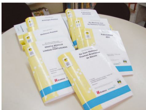
Livros em braille compõem o acervo

A biblioteca municipal Profa. Esther de Camargo Toledo Teixeira obteve, nos meses de agosto e setembro, a visitação de 1057 pessoas, entre crianças, jovens e adultos. Para consultas da