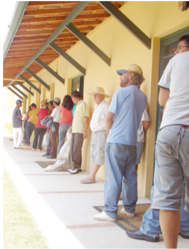
Cidadãos aguardam cesta básica

ção, panificação, artesanato, confeitaria, modelagem, informática, auxiliar administrativo, eletricista, marcenaria e costurando com arte.