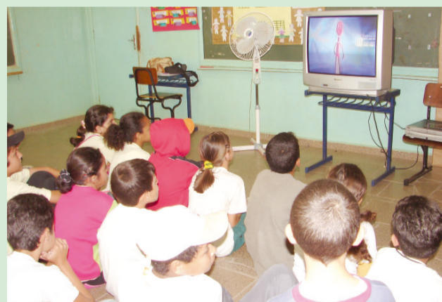
Crianças assistem vídeo sobre higiene bucal em gincana promovida pelo PSF do Jardim Santa Cruz

A higiene dental sempre foi, e será a melhor forma de preservar a saúde dos dentes e da gengiva. Esta limpeza bucal deve sempre ser executada por uma dupla eficaz e bem popular, que é: a escova de dente e o fio dental.