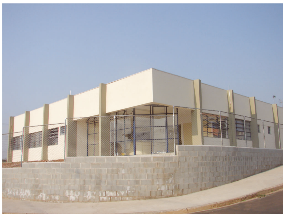
Unidade Básica de Saúde Parque Ferrúcio, uma das obras realizadas com recursos previstos no orçamento de 2007

Desde 2001, o orçamento do município cresceu 96,65%, quando o valor era em torno de R$ 12 milhões, passando para mais de R$ 17 milhões em 2003 e fechando o ano de 2006 com o equivalente a R$ 29 milhões. Todo o gasto do orçamento é previsto com antecedência e discutido durante as audiências públicas, com a participação da população, de acordo com a Lei de Responsabilidade Fiscal (Lei Complementar nº 101, de 4 de maio de 2000),