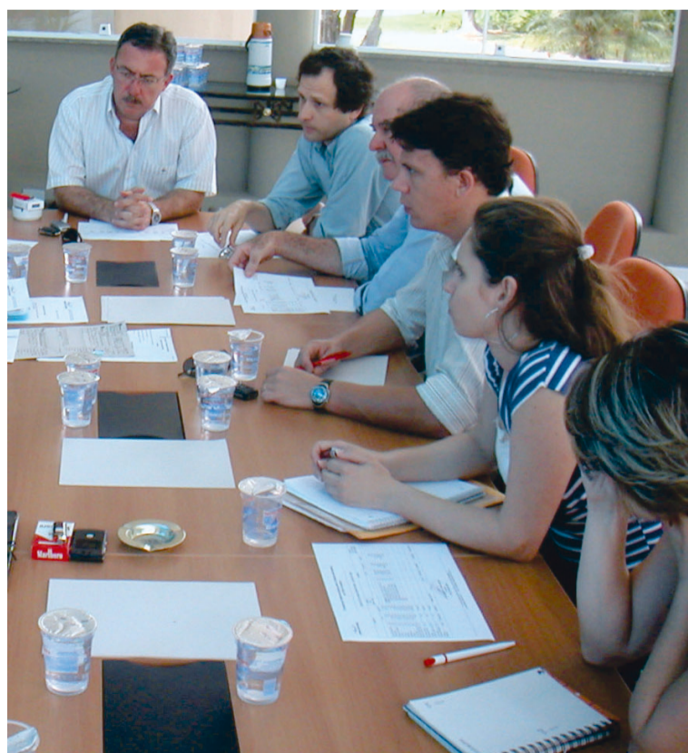
Prefeitos e secretários municipais reúnem-se em Serra Negra

Na reunião também foi debatida a possibilidade de parcerias de divulgação com a rede de televisão TVB (afiliada SBT) para a região de Campinas e Baixada Santista, assim como os ajustes necessários para a inauguração de um escritório sede do consórcio em Jaguariúna.