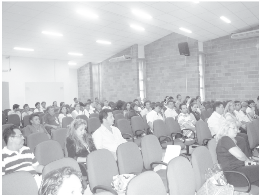
Evento contou com a participação de representantes do trade turístico e poder público da região

De acordo com Jurema Monteiro, os resultados apa-