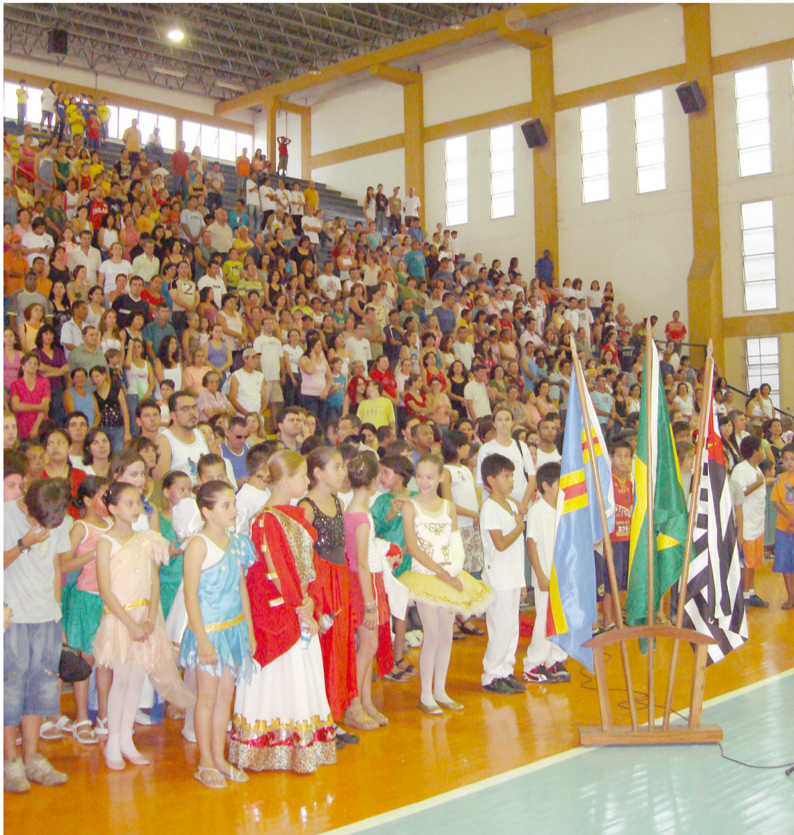
Abertura da V Feliso contou com a participação dos alunos das escolas municipais

Os estudantes das cinco escolas municipais de ensino fundamental abriram a Feliso com um desfile, que saiu da Rua Campos Salles, em direção ao Ginásio de Esportes. No trajeto, as crianças homenagearam a língua portuguesa por intermédio de grandes autores brasileiros. A EMEF Profa. Benedicta Geralda de Souza Barbosa, com os personagens de Maurício de Souza; EMEF Bela Vista e vinculadas, homenageando Ziraldo; EMEF Prof. Eduardo Rodrigues de Carvalho, com as composições poéticas de Toquinho e a EMEF