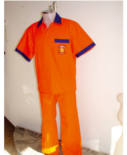
Novo uniforme da Limpeza Pública

Campos do Jordão também está entre os destinos selecionados para a primeira fase de implantação do programa, cujo lançamento ocorrerá na quarta-feira, 19. Pág.3