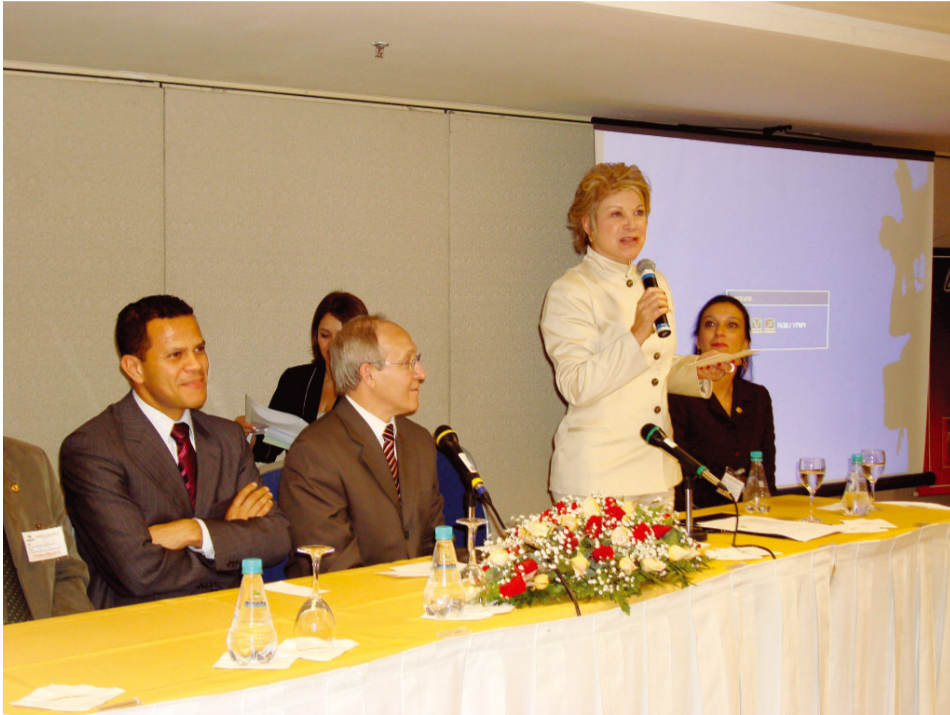
A Ministra Marta Suplicy elogiou Socorro como destino turístico

Um seminário será realizado em Socorro para lançar, oficialmente, o programa Viaja Mais – Melhor Idade, do Ministério do Turismo em parceria com o governo do Estado de São Paulo e Pre-