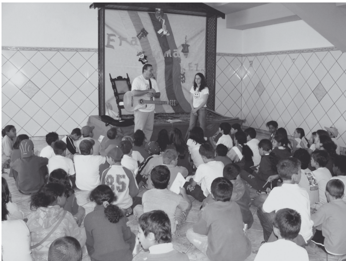
A Feliso foi um dos temas abordados no Fórum São Paulo pela originalidade do projeto

Participação de Socorro - A participação da Feliso no 3º Fórum São Paulo foi complementada por outras participações no Revelando São Paulo. Na parte de manifestações culturais, o município contou com a apresentação do grupo de Gongada de São Benedito e do Divino Espírito Santo e do grupo Morena da Fronteira