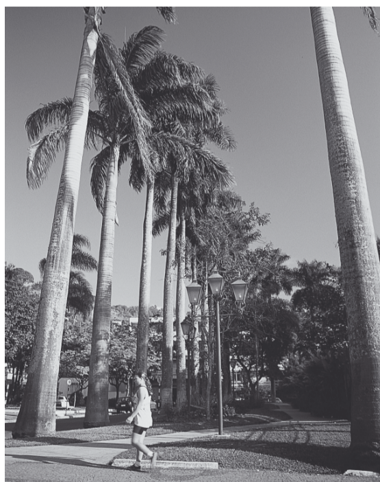
Entre as opções de lazer está o city tour

A Secretaria de Esporte, Lazer e Turismo do Estado de São Paulo realizará em Socorro o lançamento do Programa Viaja Mais – Melhor Idade, promovido em parceria com o Ministério do Turismo. O evento ocorrerá na sexta-feira, dia 21, no au-