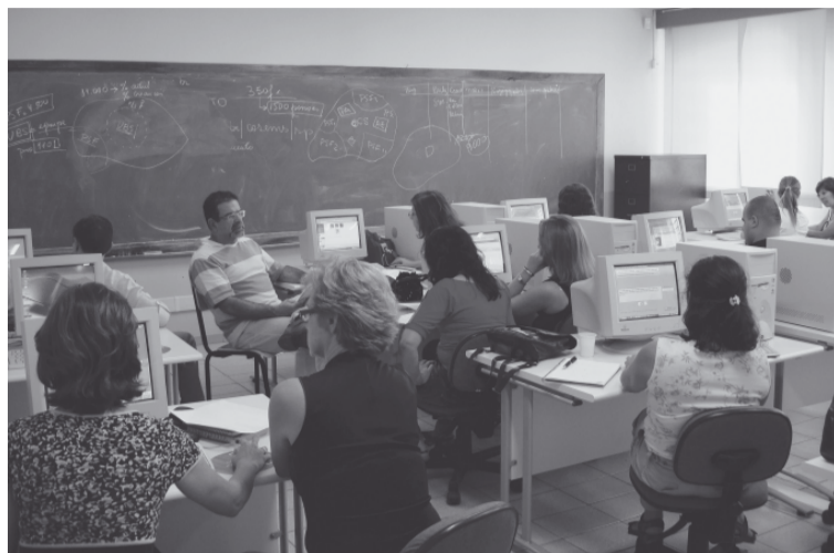
A reunião ocorreu no laboratório de informática da EMEF Bela Vista, na segunda-feira, 10

Os dirigentes de saúde dos 11 municípios que compõem a Região Bragantina de Saúde participaram, na segunda-feira, 10, de uma reunião para estudo detalhado e exercício para a assinatura do Pacto pela Saúde – Compromisso de Gestão Municipal. O encontro ocorreu na sede da EMEF Bela Vista e contou com a participação dos municípios de Socorro, Bragança Paulista, Atibaia, Joanópolis, Pinhalzinho, Pedra Bela, Piracaia, Tuiuti, Nazaré Paulista, Bom Jesus dos Perdões e Vargem Grande Paulista.