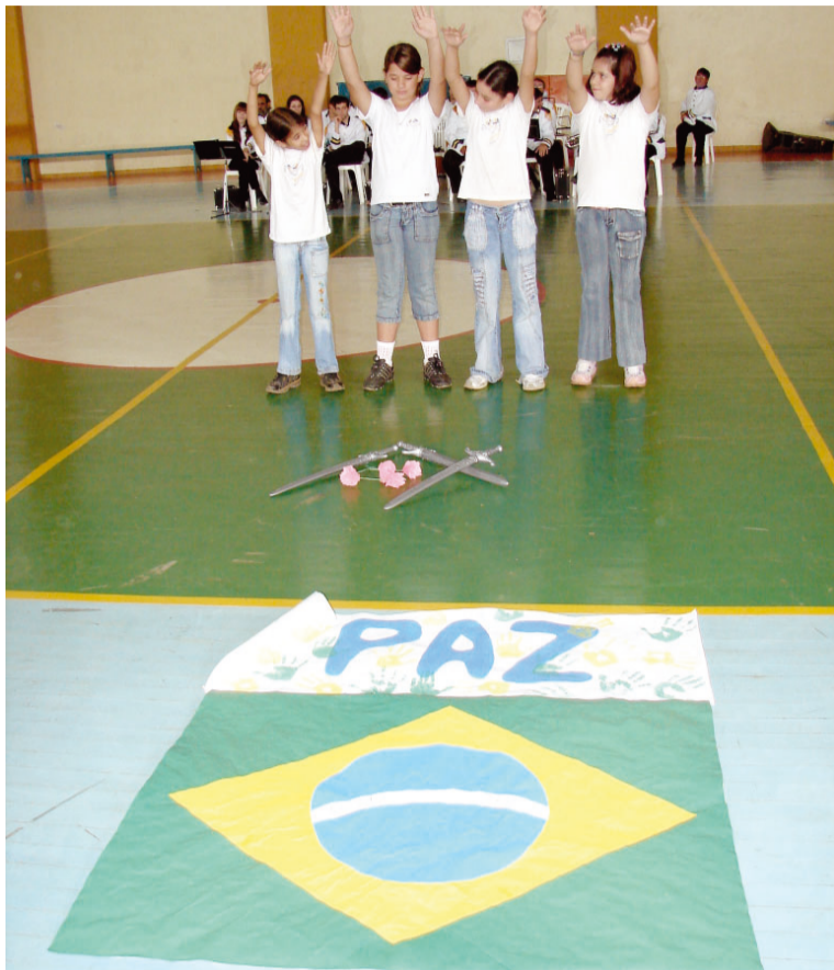
EMEF Barão de Ibitinga apresentou a música Soldado da Paz

O dia Sete de Setembro foi comemorado em Socorro com uma cerimônia cívica que reuniu autoridades locais e a população para celebrar a Independência do Brasil.