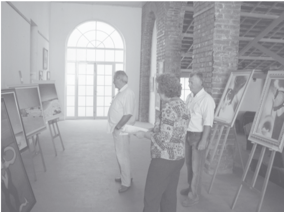
Jurados analisam as obras inscritas no concurso