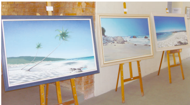
Cultura: Escolhidas obras para a fase regional do Mapa Cultural Paulista. Pág. 2