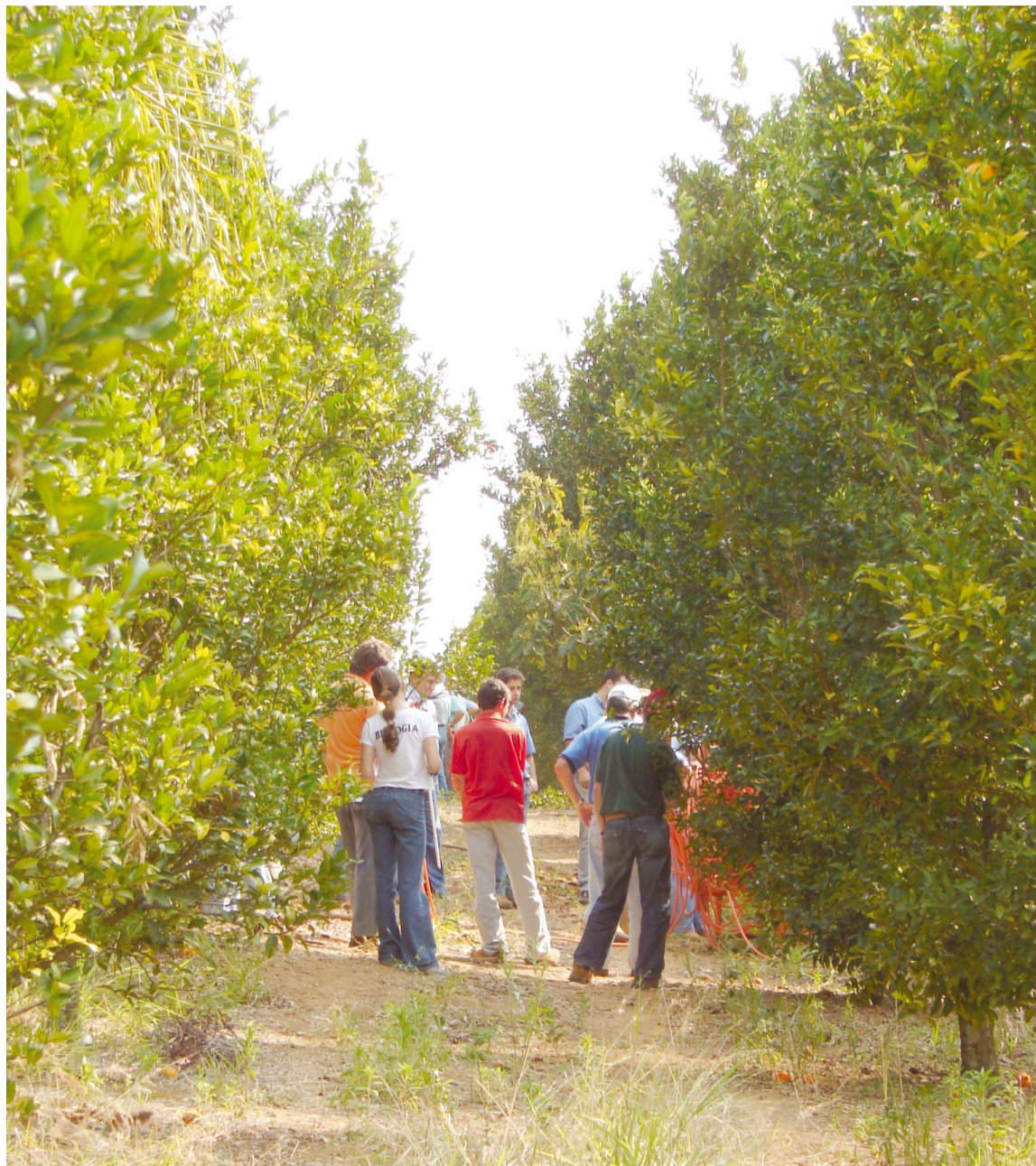
Dia de Campo incluiu visita ao pomar para a demonstração de diversas técnicas

A produção de tangerinas em Socorro está em crescimento. Existem cerca de 170 mil plantas em produção e outras 45 mil em pomares novos, ainda em formação. No município predomina a tangerina poncã, com produção média de três caixas do produto por planta. Por ser