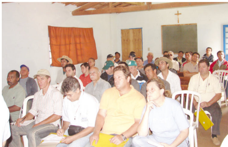
Agricultores de toda a região participaram do encontro

Com a poda, o produtor pode obter uma produção mais regular ao longo dos anos e atenuar esse fenômeno, que causa grande produção