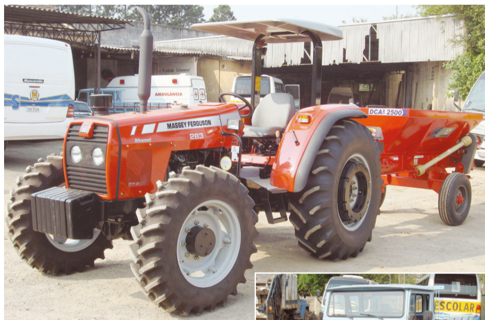
Trator zero quilômetro, distribuidor de calcário e camioneta irão ampliar os serviços oferecidos pela Prefeitura junto ao agricultor

Já a camioneta adquirida é da marca Toyota, modelo Bandeirante, ano fabricação 1990 e ano mo-