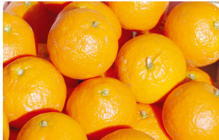
A qualidade do fruto foi tema de destaque durante o evento