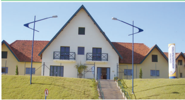
Administração: Vice-prefeito assume o comando da Prefeitura de Socorro. Pág. 2