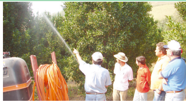
Agricultura: Dia de Campo aborda técnicas para o cultivo da tangerina. Pág. 6