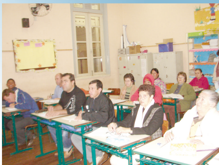
Alunos do curso de Educação para Jovens e Adultos (EJA) de Socorro

Homenagem da Prefeitura Municipal da Estância de Socorro