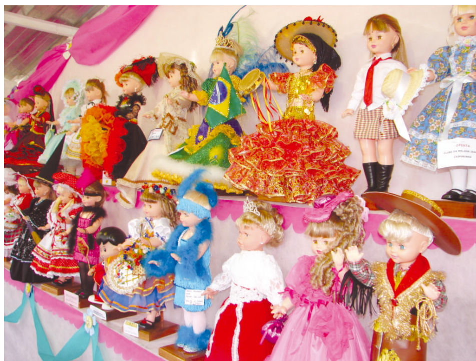
Barraca das bonecas: tradição com mais de meio século presente nas Festividades de Agosto

Ao inovar a festa, a Administração Municipal visou não somente presentear a população com dias inesquecíveis de comemoração, como também garantir a tranquilidade dos moradores da região