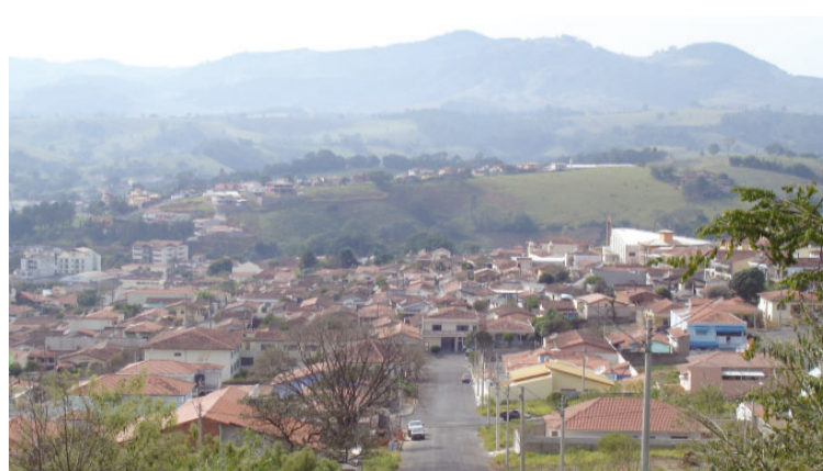
Parque Ferrúcio, um dos mais novos loteamentos do município

Grandes propriedades não podem ser divididas em pequenos lotes, sem autorização. Por isso, os fiscais e engenheiros alertam a população para não comprar lotes de origem duvidosa, já que a burocracia para regularização é grande e, às vezes, pode não dar certo.