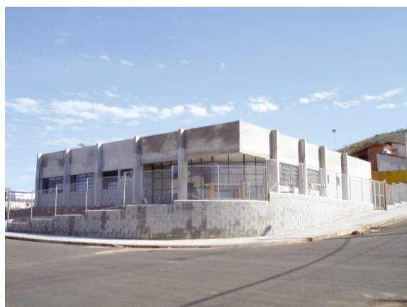
A nova Unidade de Saúde do Parque Ferrúcio/Aparecidinha encontra-se em fase de finalização