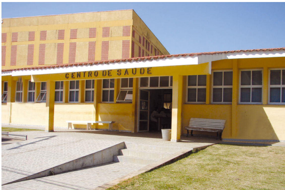
Centro de Saúde II Professor Felício Vita Júnior

A Prefeitura Municipal também cumpre sua função de distribuir medicamentos para a população. Nos meses de abril, maio e junho foram mais de um milhão de comprimidos e quase 15 mil frascos de medicamentos. O serviço somou 1.026.451 medicamentos distribuídos para a população.