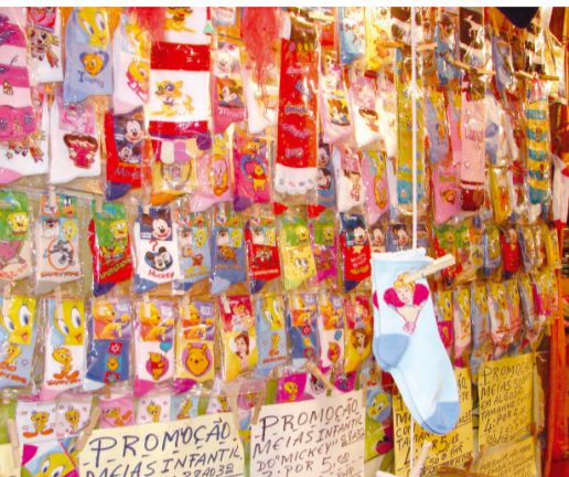
Barracas com os mais variados produtos são atrações das Festividades de Agosto

Atividades paralelas – As Festividades de Agosto contam ainda com outras atrações, fora do centro de