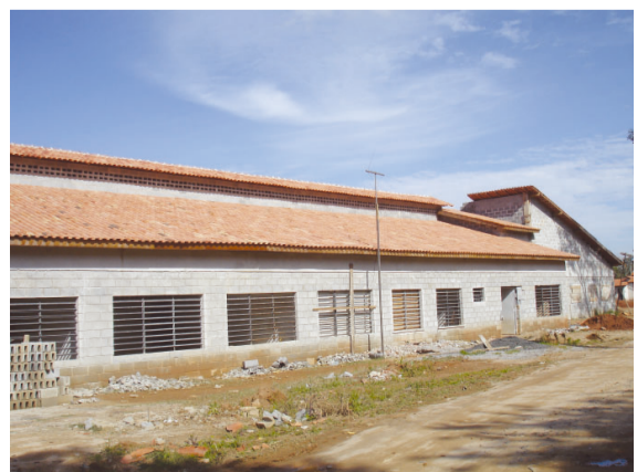
Os moradores do Jardim Santa Cruz irão contar com um novo prédio para a escola do bairro

Em breve a população do Parque Ferrúcio poderá contar com a Unidade de Saúde que está sendo construída para atender a população do bairro.