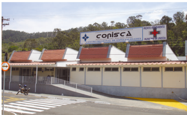
Sede do Conisca, em Lindóia

mes de endoscopia digestiva, que somou 37 procedi-