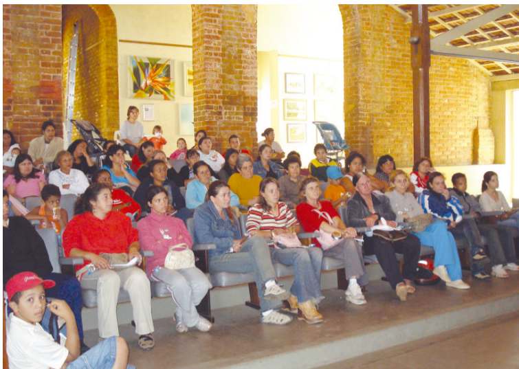
Integrantes do Programa Renda Cidadã estiveram reunidas no Centro Cultural

A reunião mensal das integrantes do programa social Renda Cidadã, ofereceu às participantes diversas dicas para geração de emprego e renda. O encontro foi realizado no Centro Cultural, na tarde de quinta-feira, 26. A palestrante do mês foi a atual diretora do Centro Municipal de Ensino Profissionalizante – Cemep/ Senai, que falou sobre os cursos regulares existentes na escola. Entre as oportunidades, foram salientados os cursos de Panificação Artesanal e Costurando com Arte, ambos realizados em parceria com o Fundo Social de Solidariedade, como também os cursos de Confeitaria, Auxiliar Administrativo, Eletricista Instalador, Informática, Marchetaria, Desenho de Moda e os cursos de Costura, que se dividem em quatro temas: costura em malha e tecido plano, costura industrial, modelagem e o costurando com arte, onde são ministradas técnicas de patchwork. Além disso, foram lembrados a realização de cursos esporádicos, como os de origami e de