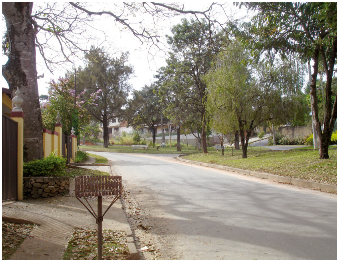
Jardim Santa Rosa é um dos loteamentos regularizados do município

O departamento de Fiscalização não é só responsável pelas construções no