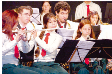
Corporação Musical União Charqueadense

De sexta-feira, 20, a programação do Festival de Inverno 2007 prestigia as manifestações culturais regionais e o incentivo à produção teatral, com apresentações de orquestras de viola e também das crianças das EMEIS de Socorro.