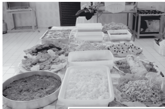
As mulheres das quatro microbacias hidrográficas de Socorro participaram do curso de culinária que capacitou o grupo para o manuseio da soja. Acima, os pratos elaborados à base de soja e ao lado, uma das alunas prepara o extrato, conhecido com leite de soja.

Entre as receitas, a professora ensinou o manejo adequado da soja para diferentes tipos de receitas, doces e salgados. As alunas aprenderam, entre outras receitas, como fazer a farinha de soja, extrato de soja, conhecido como leite de soja e diversos outros matérias primas à base de soja que podem ser aplicadas em receitas diversas. Após aprender todo o processo, as alunas elaboraram pratos com a matéria-prima, como farofa, rocam-bole salgado, enopados e o tofu ou queijo de soja. Já para a sobremesa, as alunas utilizaram o ex-