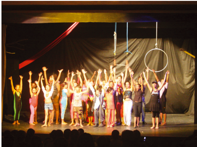
O grupo teatral Biocircos participará da abertura do Festival de Inverno de Socorro

O final de semana conta ainda com outras participações, como o Encontro de Corais, no sábado, 7, no Centro Cultural, às 20h. No domingo, 8, serão duas atrações: aula de ginástica com a Academia Equipe Sette, às 16h, na Praça da Matriz, e apresentação do grupo teatral Biocircos, da Companhia Lona das Artes, às 20h, no Centro Cultural. Pág.3