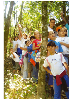
Crianças participam de atividades promovidas pela Prefeitura sobre preservação ambiental.

Também o Conselho Municipal de Defesa do Meio Ambiente – Condema foi criado para ajudar o poder público nas ações de fiscalização e preservação ambiental. O Conselho existe no município desde 1987.