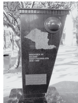
Mausoléu do Soldado Constitucionalista, monumento erguido na Praça Nove de Julho em homenagem aos socorrenses que se alistaram voluntariamente para lutar na Revolução Constitucionalista de 1932.

Socorro abrigou tropas de voluntários de toda a região e diversos moradores se alistaram para atuar no