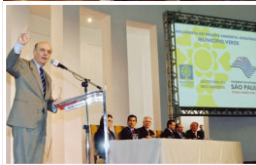
O lançamento do Programa Município Verde reuniu autoridades do Estado no Palácio dos Bandeirantes, em São Paulo.

Com o objetivo de compartilhar com os municípios a política de meio ambiente no Estado, o governador do Estado de São Paulo lançou, na terça-feira, 3, o Programa Município Verde. O evento, que ocorreu no Palácio dos Bandeirantes, em São Paulo, contou com a presença do prefeito municipal de Socorro, do vice-prefeito e do presidente da Câmara de Vereadores. Aderiram ao programa 393 municípios do Estado.