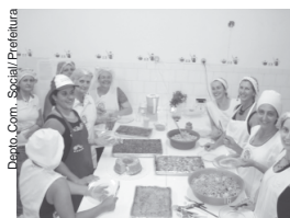
Alunas participam do curso de culinária com proteína de soja

O cardápio inclui assado de grão-de-bico com mandioquinha, creme de abacate para salada, suco tipo Ades, soja xadrez, abobrinha as-