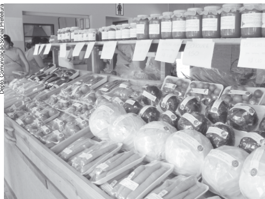
Produtos de hortifrutti variados estarão entre as opções no evento

A 5ª Festa do Morango e Produtos Orgânicos do bairro dos Pereiras, que já está em fase final de organização, trará para esta edição diversas novidades. O evento, que ocorrerá em dois finais de semana, de sexta-feira a domingo, entre os