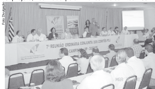
7ª Reunião Ordinária Conjunta dos Comitês PCJ

Neste momento o comitê, através de sua Câmara Técnica de Educação Ambiental (CTEA) irá definir o número de kits a serem adquiridos, os critérios de distribuição e os recursos financeiros necessários, para posterior apreciação dos plenários dos comitês PCJ.