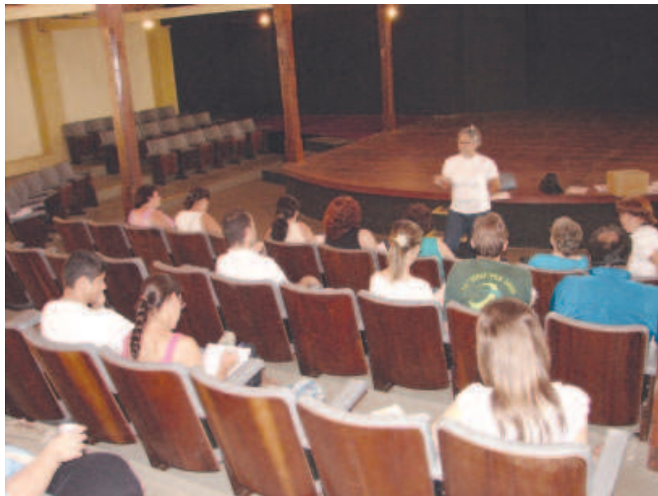
Sucen reúne técnicos da região para intensificar ações no combate à dengue

Os sintomas podem ser confundidos como uma gripe ou virose convencional. Apenas com exames laboratoriais é que a doença pode ser detectada e tratada corretamente.