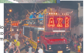
Trio Elétrico Cremasom