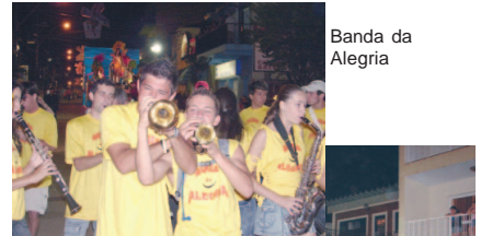
Banda da Alegria