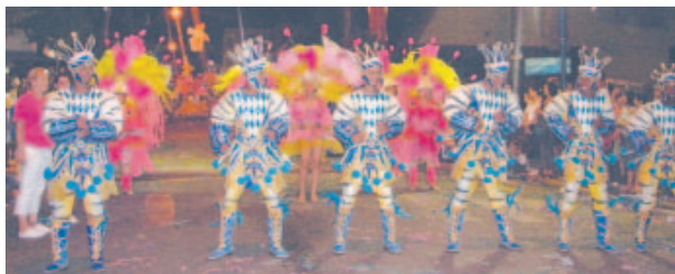
Comissão de Frente G.R.E.S. Dragão Imperial