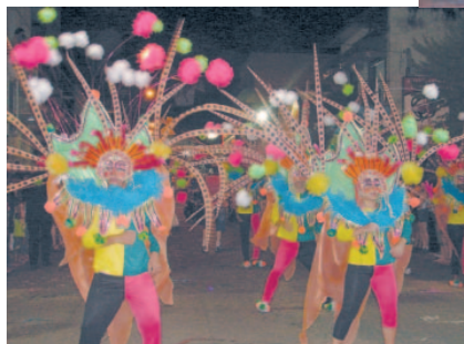
Alegoria G.R.E.S. Júlio de Mesquita