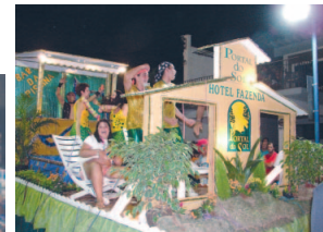
Portal do Sol