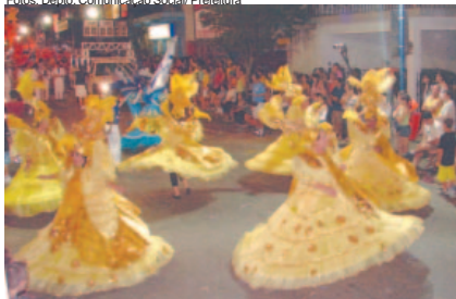
Ala das Baianas G.R.E.S. Caprichosos do Samba