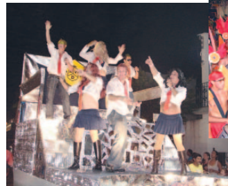
Os Revortados - Equipe Abutre