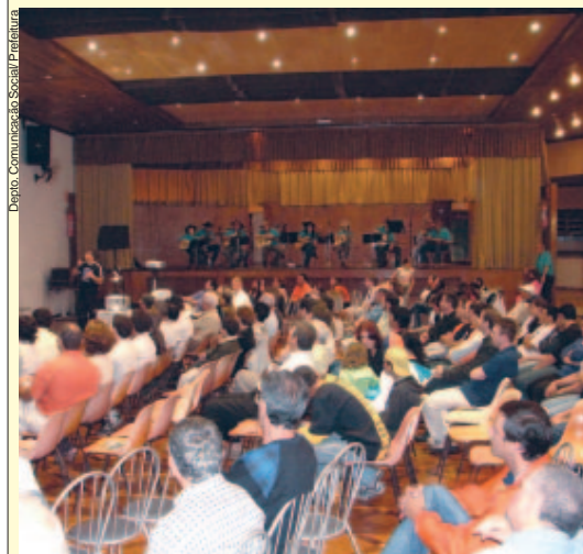
O Comtur de Socorro, um dos mais importantes do Estado, comemorou 10 anos de existência em 2006, com um evento no Clube XV de Agosto, atraindo autoridades de toda a região.

O Conselho se reúne uma vez ao mês. As reuniões são abertas à comunidade e qualquer pessoa pode participar, inclusive oferecendo sugestões e soluções. Em março, o encontro será realizado no dia 12, no salão comunitário da igreja do bairro dos Pereiras, quando a associação de moradores apresentará um projeto para a realização da 5ª Festa do Morango e Produtos Orgânicos.