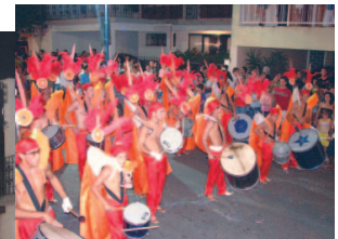
Bateria G.R.E.S. Caprichosos do Samba