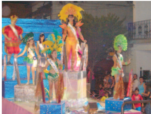
Carro da Corte do Carnaval 2007