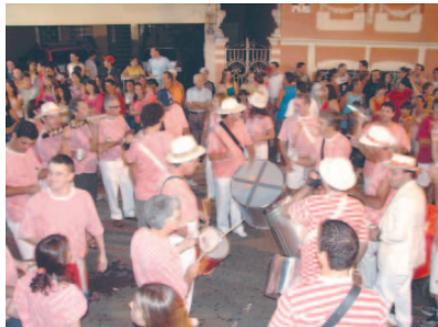
Sambistas Sem Tradição