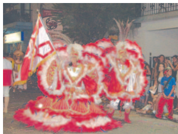
Mestre-sala e porta-bandeira G.R.E.S. Nove de Julho