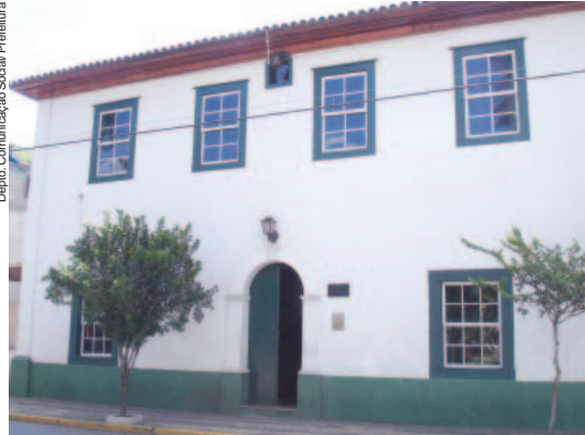
Fachada do Museu Municipal

O município de Socorro está entre os que mantêm viva a memória e história da fundação da cidade, personalidade políticas e da sociedade que marcaram época, assim como grandes eventos e datas comemorativas, em diversos objetos expostos no Museu Municipal.