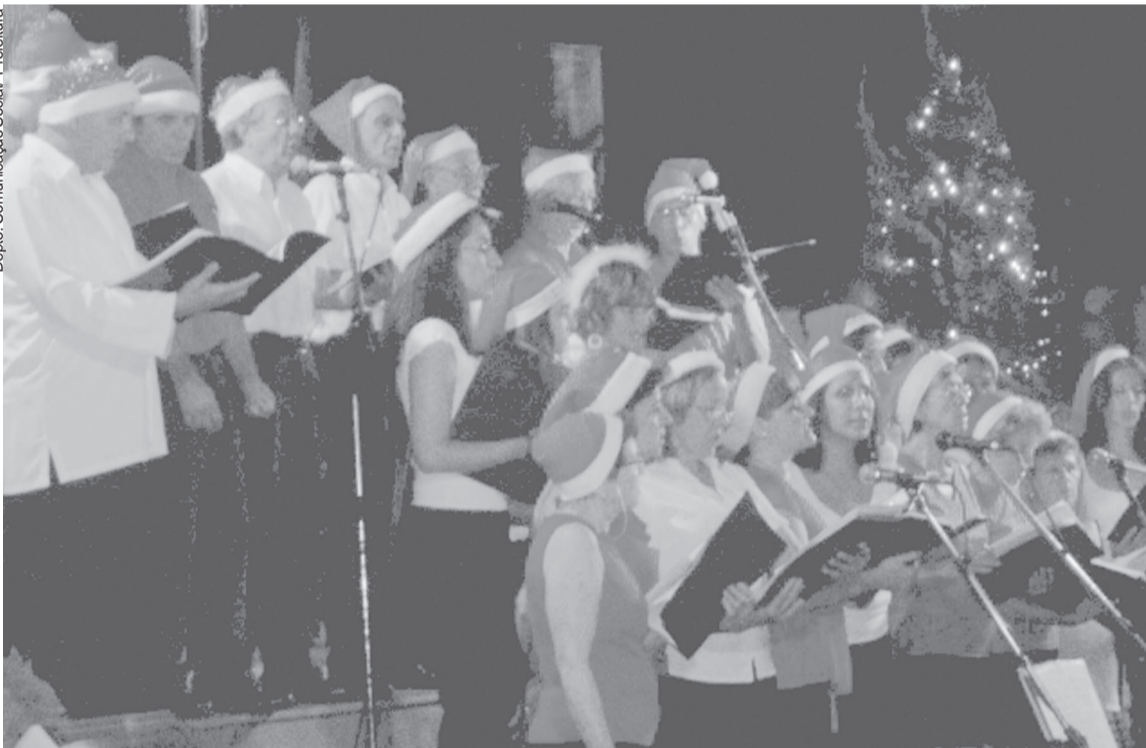
O coral municipal se apresentou na terça-feira, 19, à noite, nas escadarias do Paço Municipal

Músicas clássicas, natalinas e populares dão o tom para as comemorações de Natal e Ano Novo, em Socorro. A população poderá acompanhar hoje (sexta-feira, 22), a apresentação da Retreta de Natal da Corporação Santa Cecília, na Praça da Matriz, às 20h30.