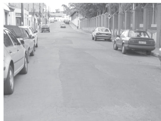
Rua Professor Cornélio Alves de Andrade

Gollo, Jardim Araújo, Jardim Teixeira, Jardim Jussara e Jardim Santa Rosa.