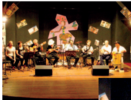
O grupo Ensaio Geral abriu as apresentações da noite