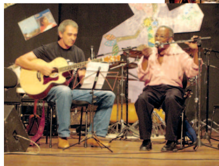
Sucessos atuais de Fundo de Quintal, Raça Negra e Inimigos da HP foram interpretados pelo grupo Inspiração do Samba