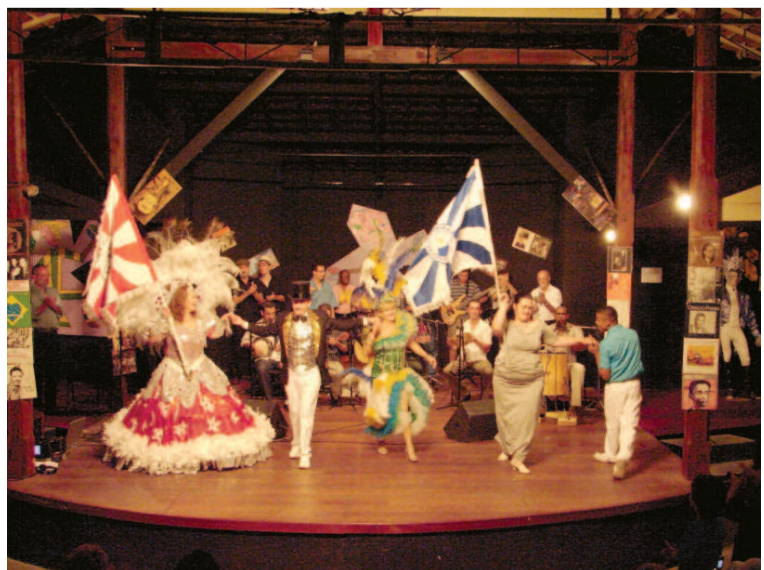
A homenagem foi encerrada com a participação dos mestres-salas e porta-bandeiras das G.R.C.E.S. Falange e Caprichosos do Samba