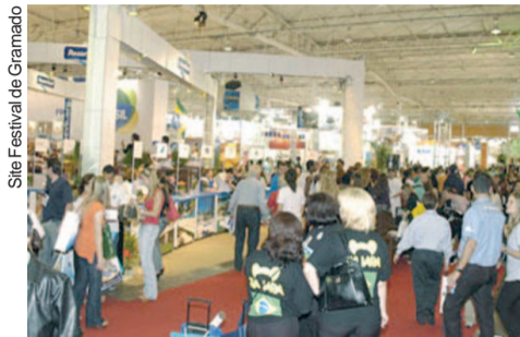
Site Festival de Gramado

Considerada uma das feiras de turismo mais importantes no Brasil, a 18ª edição do Festival do Turismo de Gramado aconteceu de 16 a 19 de novembro, e contou com a participação da Estância de Socorro, em conjunto com as demais cidades que compõem o Circuito das Águas Paulista. O evento permitiu a exposição das opções de passeios da região para profissionais do setor de turismo.