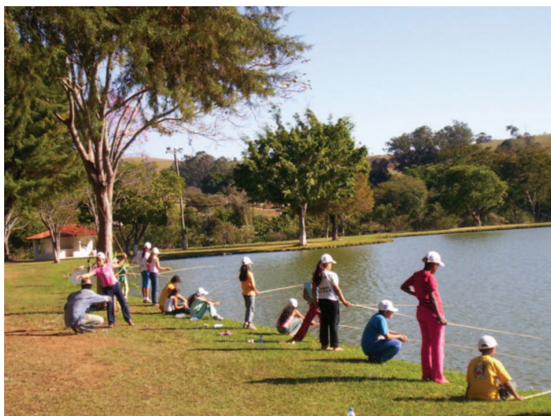
Passeio no pesqueiro

Ao completar 18 anos, os jovens devem realizar o Alistamento Militar na Junta de Serviço Militar mais próxima de sua residência. As mulheres são isentas em tempo de paz. Em Socorro, a Junta Militar está localizada à Rua Dr. Alfredo de Carvalho Pinto, 283. Mais informações podem ser obtidas pelo telefone (19) 3855-3277.