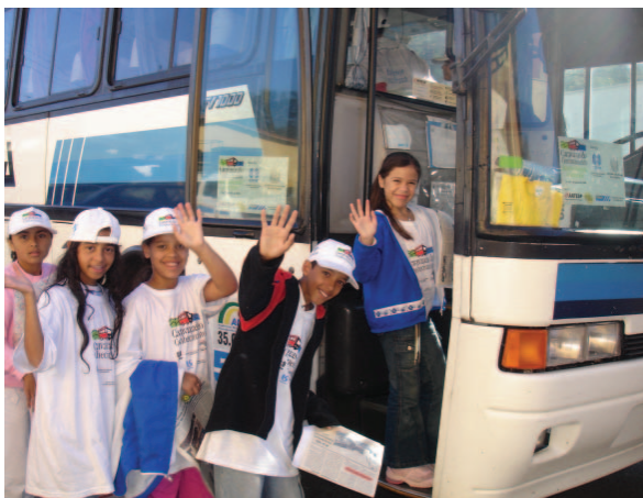
Crianças no retorno à São Paulo

Realizado pelo Governo do Estado, através das Secretarias de Economia e Planejamento e da Educação, em conjunto com as Prefeituras Municipais, o Programa Caravanas do Conhecimento é organizado e coordenado