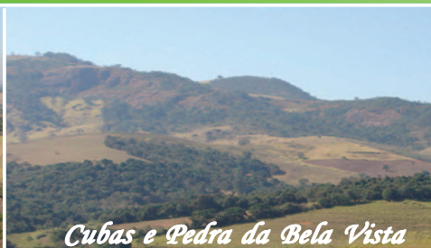
Cubas e Pedra da Bela Vista