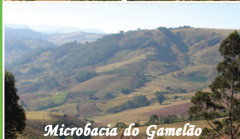
Microbacia do Gamelão