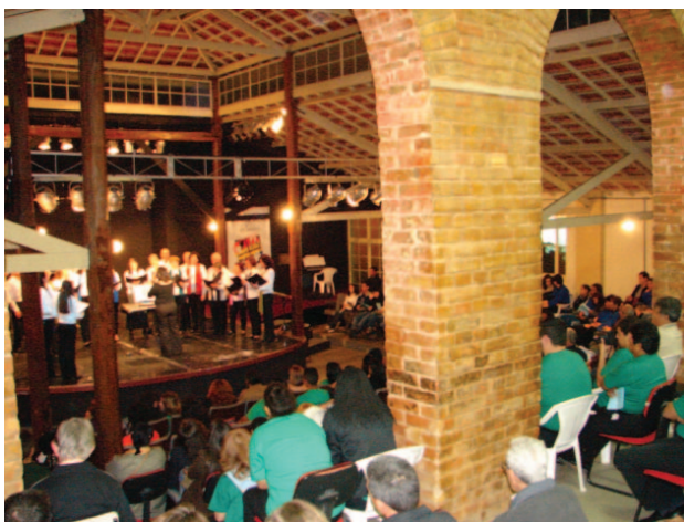
Encontro de Corais

O VI Festival de Inverno realizado pela Prefeitura Municipal, tem levado à população e turistas que visitam a Estância, arte e espetáculos que valorizam a produção cultural local e regional. A programação, que teve início em 1º de julho, se estenderá até o dia 30, com atrações para públicos de todas as idades. Confira a programação dos próximos finais de semana: