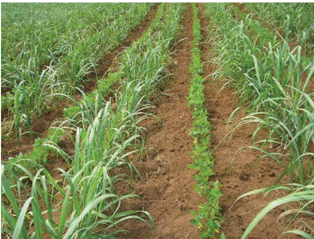
Cultivo orgânico de cana consorciada com feijão, no sítio Santo Antônio