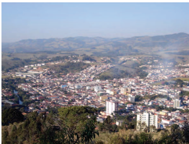
Vista panorâmica da cidade de Socorro

O Plano Diretor é um instrumento da política de desenvolvimento e expansão urbana de um município. Seu objetivo é orientar a atuação do poder público e da iniciativa privada na construção do espaço urbano, garantindo a oferta dos serviços públicos essenciais, ao mesmo tempo assegurando melhores condições de vida à população. Pág. 03