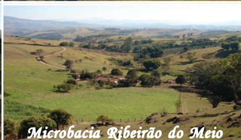
Microbacia Ribeirão do Meio