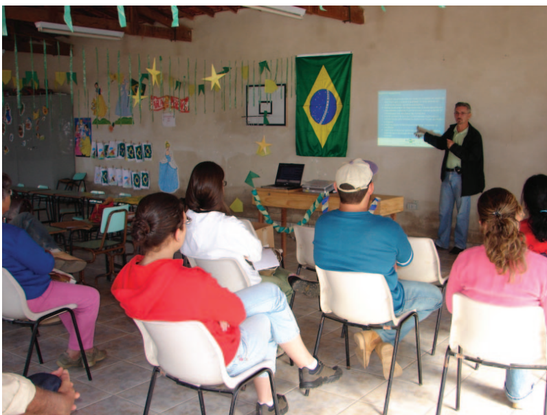
Palestra ministrada por técnico da Embrapa Meio Ambiente aos produtores rurais

A Guarda Civil Municipal de Socorro realiza seu plantão de atendimento pelo tel. 3895-1085.