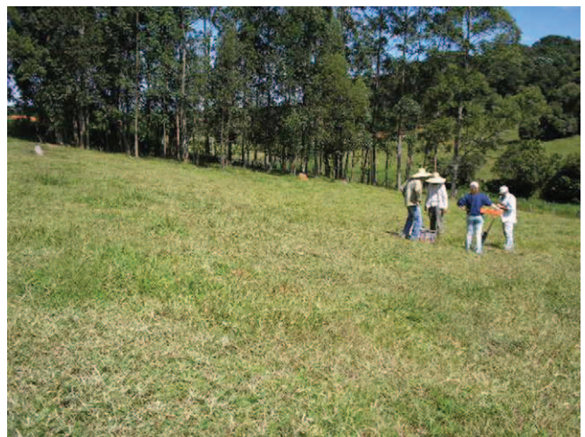
Equipe técnica da Embrapa realiza coleta comparativa em pastagem do sítio

Familiar Orgânica e Convencional”, é coordenada pela Embrapa Meio Ambiente, em parceria com a Casa da Agricultura/ Cati, Fapesp e produtores rurais.