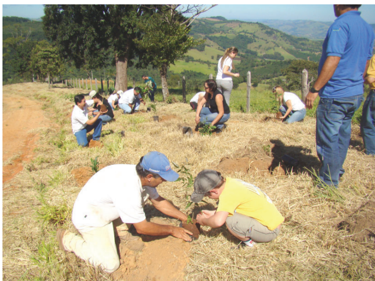
Plantio em uma das propriedades parceiras da iniciativa