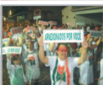
Drª Linamara - secretária de Estado - Direito das Pessoas com Deficiência e família