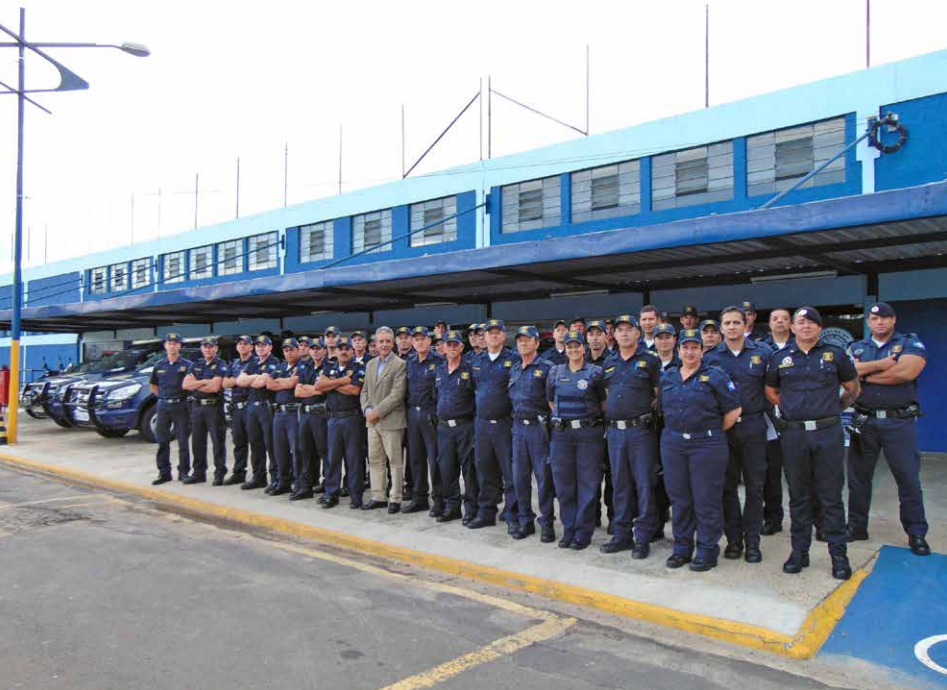
Guardas Municipais e o ex-secretário de Segurança e Defesa do Cidadão